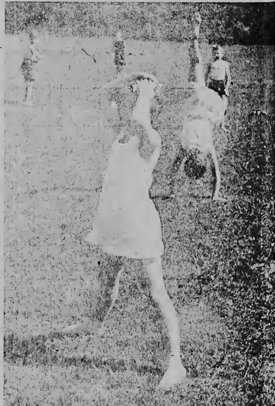
Riba e terreno di sport e prinses di anhe anja ta sosoga un rato. Y naturalmente tabata tin un fotografu eue a saca su portret; esaki no ta un portret lief?